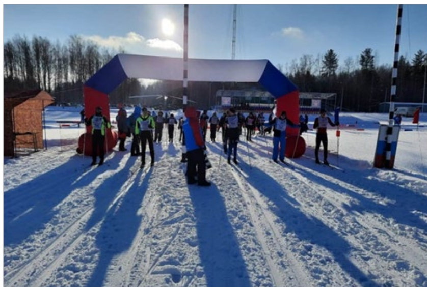
Рис. 2. Юнармейский лыжный спринт в рамках спартакиады войск РХБ защиты.

Кроме этого для всех участников соревнования и зрителей в парке «Патриот» Военной академии РХБЗ были организованы экскурсии в Партизанскую деревню и на площадку реконструкции подвига 26 отдельной роты фугасных огнеметов (подвиг совершён 1-2 декабря 1941 г.). Все желающие ознакомились с историческими и современными образцами вооружения и средств войск радиационной, химической и биологической защиты ВС РФ. Кроме этого командованием Военной академии РХБЗ совместно с департаментом культуры Костромской области организовано культурно-досуговое сопровождение соревнований.