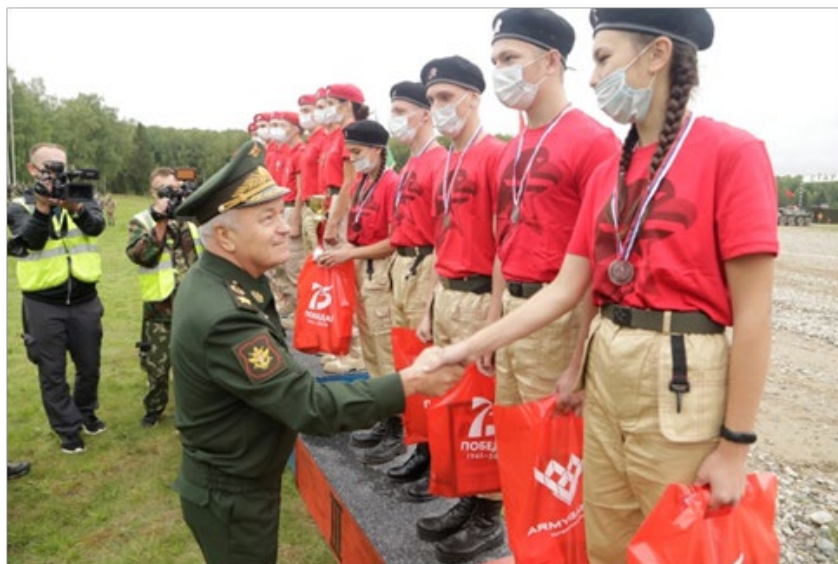
Рис. 3. Награждение победителей конкурса «Безопасная среда».

Программа соревнований включает в себя 2 блока. В программу соревновательного блока входят: полоса препятствий «Полоса мужества»; надевание средств индивидуальной защиты (организаторы – офицеры и курсанты Военной академии РХБЗ); стрельба из пневматической винтовки (организаторы – представители «ДОСААФ»); интеллектуальная викторина «История Победы» (организатор – Костромское отделение «Российского военно-исторического общества»). Программу образовательного блока составляют: турнир по лазертагу (организатор – Комитет по делам молодежи); площадка средств специальной обработки (организатор – Военная академия РХБЗ); мастер-классы по действиям при возникновении чрезвычайных ситуаций и оказанию первой помощи пострадавшим (организаторы – специалисты «Школы безопасности» и МЧС России); командообразующая площадка (организаторы – сотрудники и студенты института педагогики и психологии Костромского государственного университета); интерактивные площадки по добровольческой деятельности (организаторы – представители «Российского Движения Школьников»).