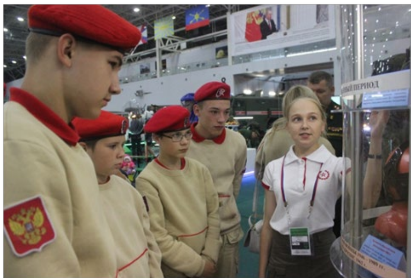
Рис. 4. Работа Клуба болельщиков в парке «Патриот».

«Безопасная среда», которая в 2021 году из 34 конкурсов, по мнению Юнармейцев, признана одной из лучших площадок (рис. 4).