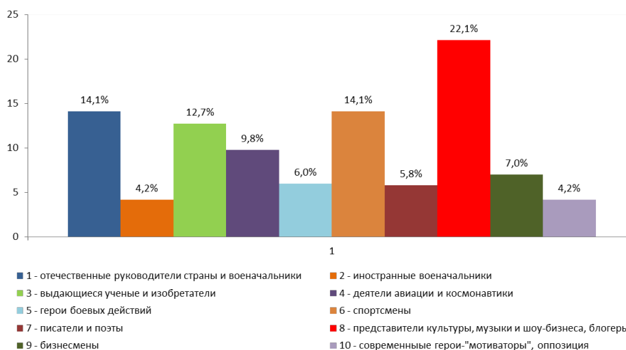
Рис. 1. Распределение значимых исторических личностей по группам у российской молодежи.

Все это ложится на уже признаваемые как специалистами-исследователями, так и обществом в целом, тенденции деградации современной российской молодежи. Мировоззрение молодежи формируется западными ценностями, клиповым мышлением, непроверенной информацией. В итоге опросы показывают, что связь с историческим прошлым стремительно теряется: молодые люди путают события и даты, не ориентируются в исторических личностях и их вкладе в развитие государства и мира [7]. В 2021 году проведенный в Воронежской области опрос молодежи о значимых для каждого респондента исторических личностях позволил объединить ответы в несколько условных групп (рис. 1).